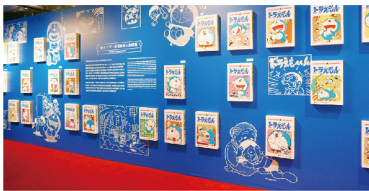
▲ 藤子・F・不二雄老師復刻工作室首度在台公開，一同探訪哆啦A夢誕生之地。