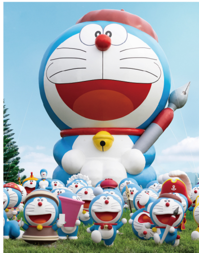
▲ 超過百種立體可愛造型哆啦A夢一次捕捉。