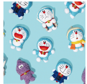
▲ 豐富展覽限定周邊，從日常小物到可愛擺飾，趕緊來入手。